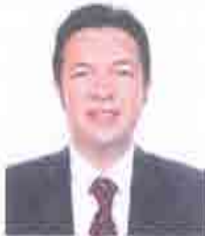
Dip. Próspero Manuel Ibarra Otero