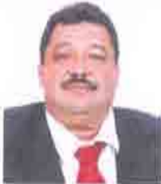
Dip. Efraín Arellano Núñez